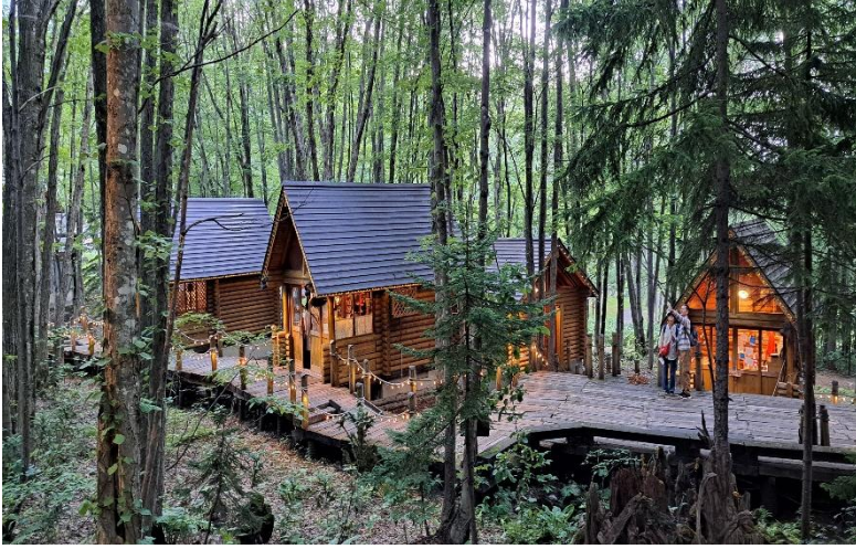
森林精靈露台 (Ningle Terrace)